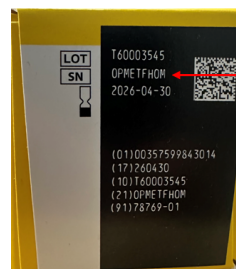
Emballage du capteur

Dans le lecteur, depuis le Menu des Paramètres, appuyez sur Etat du système et puis Information sur le système