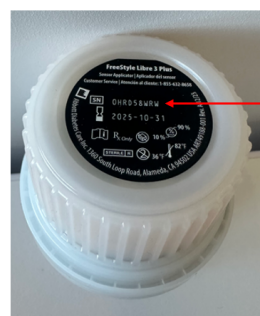
Etiquette de l'applicateur du capteur

Nous avons informé Le Ministère de la Santé et de la Sécurité sociale.